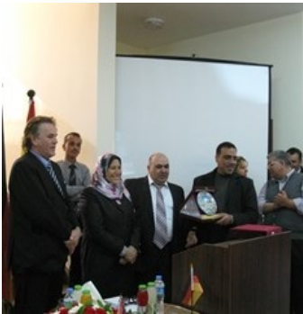
ممثلون عن المؤسسات الداعمة يتلقون درع تكريمي خلال الاحتفال