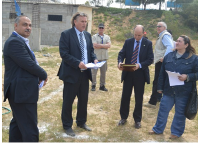
السيد راولي برفقة ممثلي البرنامج في موقع المشروع بيت لاهيا

ضمن زيارته الى قطاع غزة، قام السيد جيمس راولي منسق الشؤون الانسانية للأمم المتحدة بزيارة برنامج الأمم المتحدة الإنمائي/ برنامج مساعدة الشعب الفلسطيني وذلك في موقع مشروع مركز الشافعي للتدريب التقني، وهو المشروع المتوقع منذ اعوام عديدة بسبب ظروف الحصار والاعلاق المفروضة على قطاع غزة. المشروع المتوقع كان سيوفر 3,360 يوم عمل بالإضافة الى 30 فرص عمل دائمة من خلال نشاطاته في القطاع، كما كان من المفترض ان يكون المركز التقني الوحيد في منطقة بيت لاهيا الذي يستهدف الفقراء من الشباب والشابات ويدربهم في عدة مجالات تقنية كالحداثة والتجارة وصيانة السيارات والأجهزة الكهربائية. كان في استقبال السيد راولي وفد من البرنامج حيث قام بإطلاع الزائر على الأوضاع الانسانية التي يعيشها القطاع، وعن حالة الحصار والاعلاق التي يعاني منها بشكل متواصل منذ عدة أعوام، والتي ألفت بظلالها على معظم مناحي الحياة في القطاع.