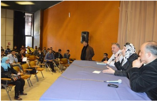
جانب من الاجتماع السنوي لطلاب الفاخورة

عقد برنامج الفاخورة للمنح الدراسية اجتماعه السنوي للطلاب المستفيدين من البرنامج، حيث تم خلال اللقاء الحديث عن آخر مستجدات البرنامج، وتم تبادل النقاش المفتوح بين الطلاب وبين القائمين عليه في برنامج الأمم المتحدة الإنمائي. ومن جهة أخرى، عقد برنامج الفاخورة ورشة عمل لتحديد ووضع معايير تحكم اختيار الطلبة المستفيدين من البرنامج. حضر الورشة العديد من ممثلي المؤسسات والجمعيات الأهلية في قطاع غزة، وقد انقسموا الى 3 مجموعات كل واحدة تناقش على