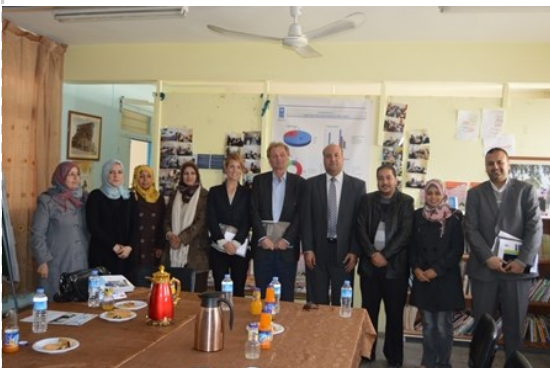
الوفد الزائر والعاملين في العيادة القانونية في صورة جماعية بعد نهاية اللقاء في مقر العيادة القانونية- مخيم الشاطئ

زار وفد من القنصلية العامة للسويد يرأسه القنصل السيد فريدريك ويست هولم برنامج الأمم المتحدة الانمائي/ برنامج مساعدة الشعب الفلسطيني، وتحديداً برنامج سيادة القانون و الوصول الى العدالة.