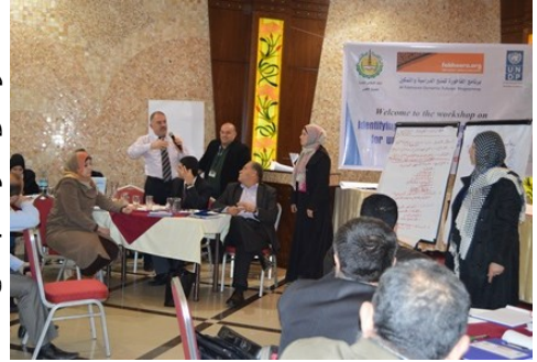
جانب من النقاش المثار في ورشة العمل حول معايير اختيار الطلاب المستفيدين من المنح الدراسية وبرامج التدريب

عقد برنامج الفاخورة للمنح الدراسية اجتماعه السنوي للطلاب المستفيدين من البرنامج، حيث تم خلال اللقاء الحديث عن آخر مستجدات البرنامج، وتم تبادل النقاش المفتوح بين الطلاب وبين القائمين عليه في برنامج الأمم المتحدة الإنمائي. ومن جهة أخرى، عقد برنامج الفاخورة ورشة عمل لتحديد ووضع معايير تحكم اختيار الطلبة المستفيدين من البرنامج. حضر الورشة العديد من ممثلي المؤسسات والجمعيات الأهلية في قطاع غزة، وقد انقسموا الى 3 مجموعات كل واحدة تناقش على