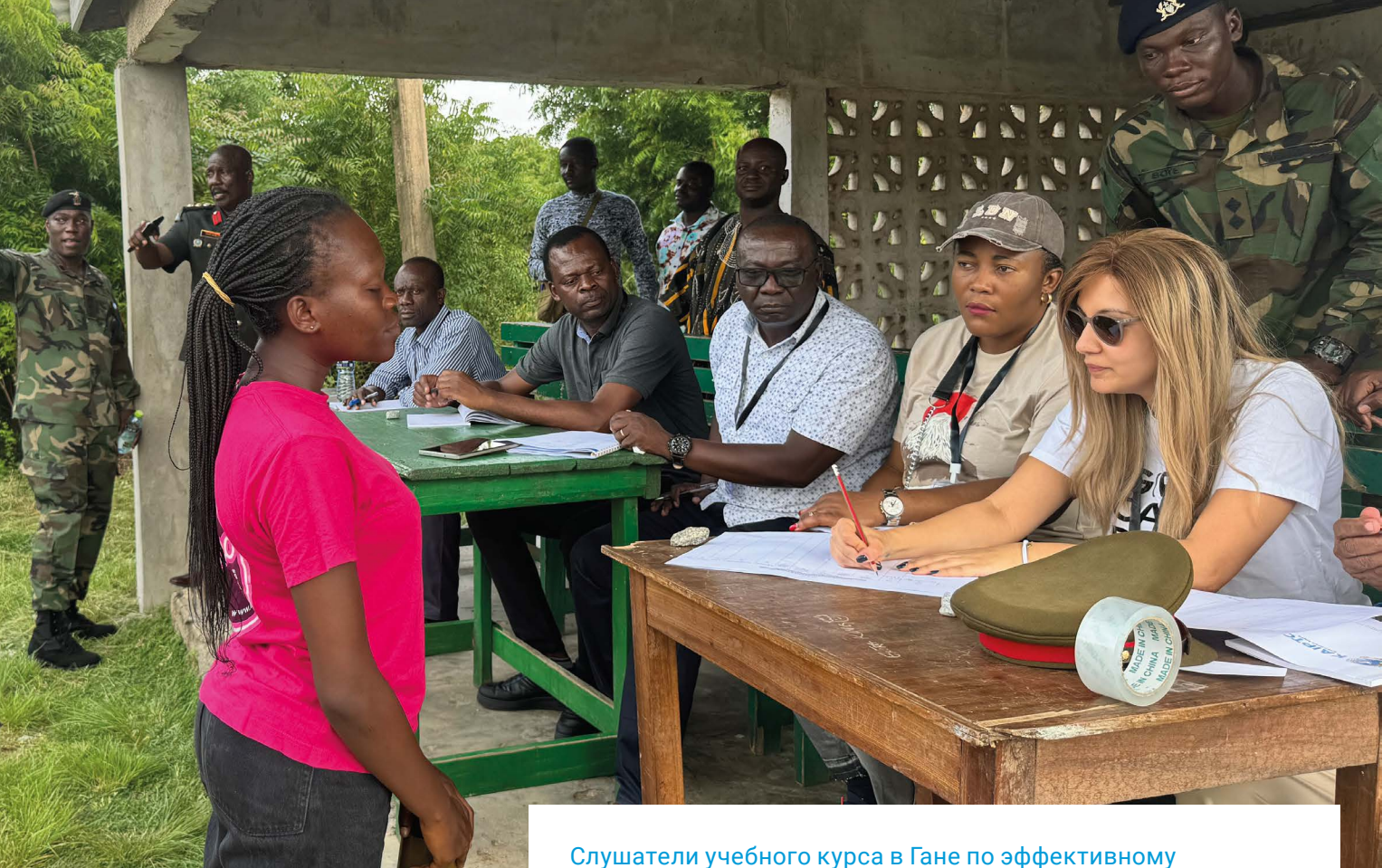
Слушатели учебного курса в Гане по эффективному управлению запасами оружия и боеприпасов в меняющемся контексте разоружения, демобилизации и реинтеграции.

(Аккра, ноябрь 2024 года)