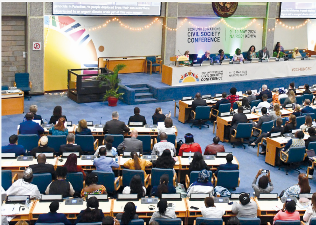
2 000多名与会者聚集在内罗毕参加联合国民间社会会议，为2024年未来峰会做准备。

对此，秘书长提出了一份题为“我们的共同议程”的报告，呼吁人民、国家、世代团结一心，并相应更新多边体系，以加快履行现有承诺，填补全球治理方面的空白。秘书长在报告中提议召开未来峰会，就我们的未来应当是什么样以及当前如何可以确保实现这一未来达成全球共识。