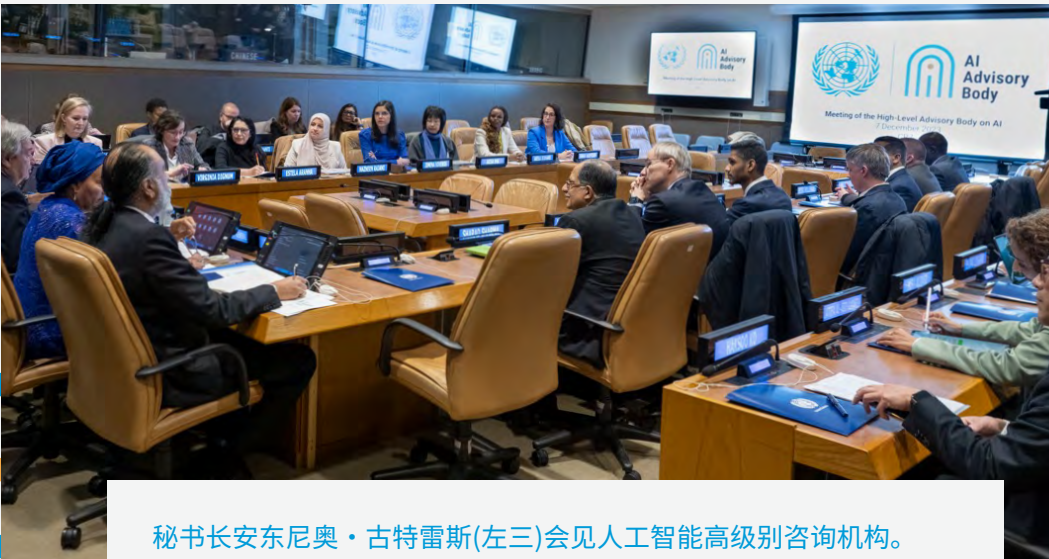
秘书长安东尼奥·古特雷斯(左三)会见人工智能高级别咨询机构。