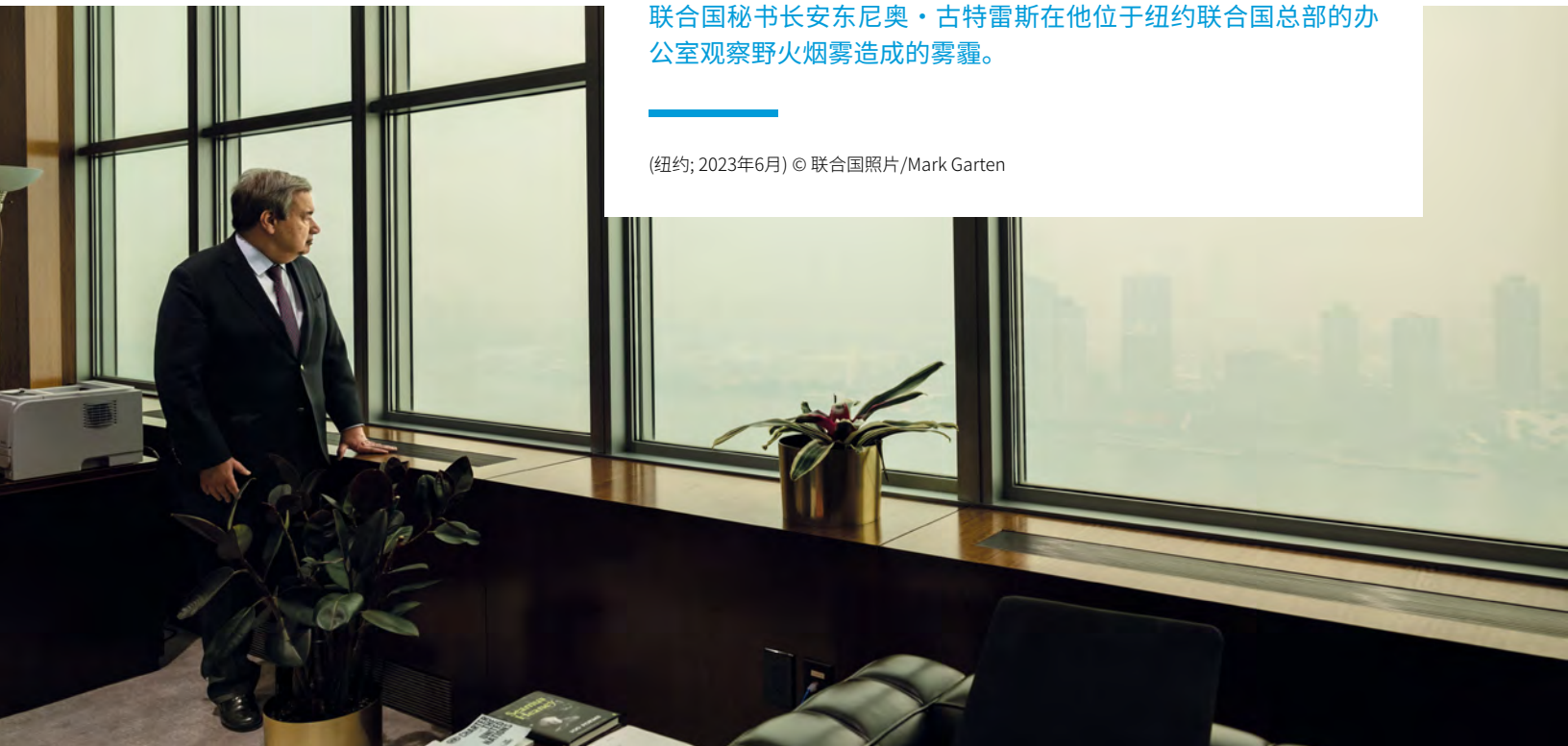
联合国秘书长安东尼奥·古特雷斯在他位于纽约联合国总部的办公室观察野火烟雾造成的雾霾。