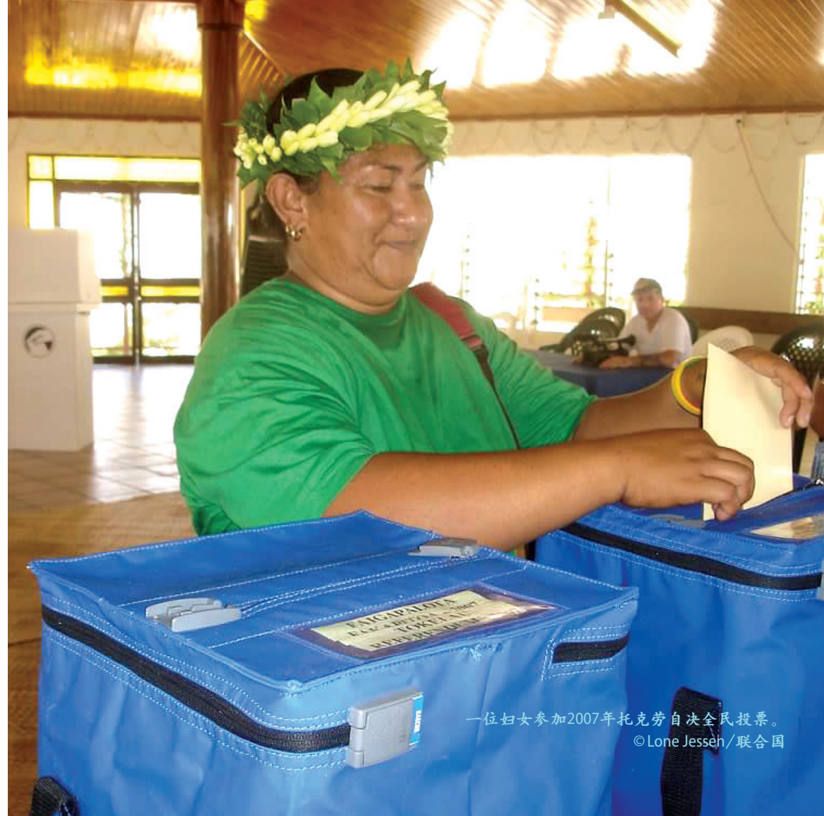
一位妇女参加2007年托克劳自决全民投票。