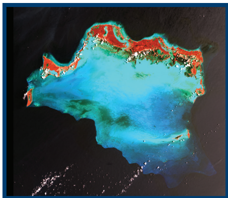
2003年4月24日美国航天局拍摄的特克斯和凯科斯群岛卫星图像。

11 资料来源: http://www.unaids.org/en/regionscountries/countries/fiji