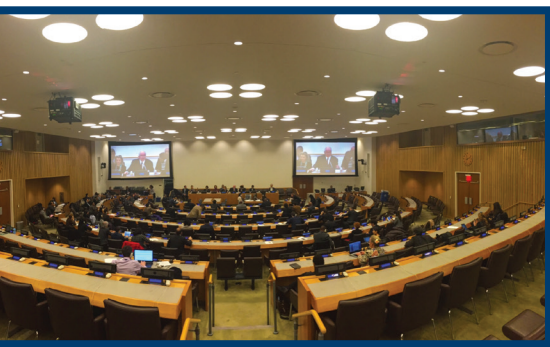
2016年2月25日非殖民化委员会(二十四国特别委员会)的开幕会议。