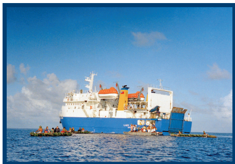
航行于萨摩亚与美属萨摩亚之间的渡轮“Naomi夫人”号停靠在托克劳3个环礁岛之一阿塔福岛外。

联合国粮食及农业组织(粮农组织)支持在农业、林业、渔业、粮食安全、营养等方面采取可持续农村发展政策和做法。优先工作领域之一是在粮食安全和营养方面提高抵御灾害和气候变化的能力。粮农组织在外地办事处协助下向非自治领土提供援助，其中包括设在巴巴多斯的加勒比次区域办事处和设在萨摩亚的太平洋岛屿次区域办事处。在非自治领土中，托克劳是粮农组织太平洋岛屿次区域办事处的准成员。