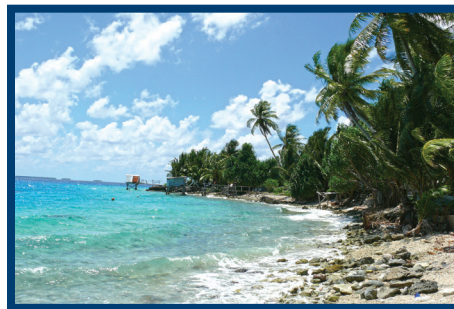
努库诺努环礁岛海滨。世界上易受气候变化影响的地区之一。托克劳的努库诺努环礁岛。

8 资料来源: http://www.jm.undp.org/content/jamaica/en/home/operations/contact_us.html