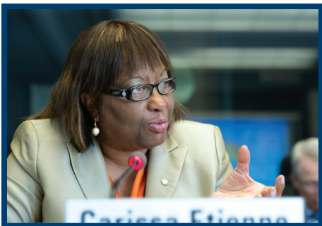
世卫组织美洲区域主任Carissa Etienne博士在“2015年后可持续发展目标中的卫生事项”技术简报会上发言。

切协作，以连贯协调方式支助非自治领土，在解决其卫生问题方面提高效率、增进相互了解、统一立场。它们的工作范围涵盖安圭拉、百慕大、英属维尔京群岛、开曼群岛、蒙特塞拉特、特克斯和凯科斯群岛。