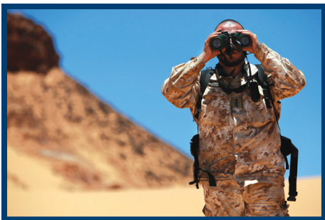
西撒特派团观察员，西撒哈拉。