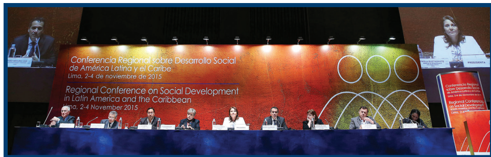
拉加经委会拉丁美洲和加勒比社会发展问题区域会议，2015年11月。

联合国大会纪念《给予殖民地国家和人民独立宣言》颁布50周年。2010年12月14日，纽约，联合国。