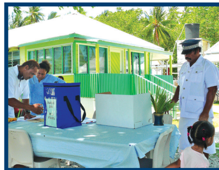
一名选举干事在设于因努库诺努医院的简易投票间核实选民的选票。托克劳法考福。2007年10月24日

如果管理国和领土人民提出请求,该部的 选举援助司 可为举行决定领土未来地位的全民投票提供技术咨询意见,或观察全民投票进程。例如,2006年2月和2007年10月,选举援助司一名选举专家与非殖民化特别委员会成员应邀前往托克劳监督全民投