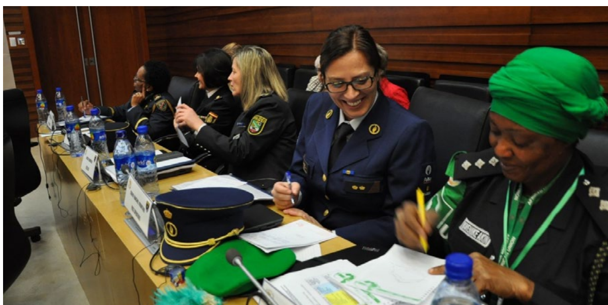
First Female Police Commanders Course, 3rd – 8th December 2017

La présente note d'orientation a souligné les possibilités d'inclusion numérique des femmes dans l'agenda FPS de l'Afrique, qu'il s'agisse de mesures préventives, d'un engagement précoce ou de la facilitation d'une mobilisation efficace susceptible de conduire à un changement politique en faveur de la paix. Des appels ont également été lancés pour que l'agenda FPS soit moins traditionnel dans sa conception de la sécurité et plus sensible au fait que les technologies nouvelles et émergentes nécessitent des efforts plus délibérés pour améliorer la cybersécurité. Ceci est particulièrement important car le développement des technologies de surveillance et d'espionnage aura un impact significatif sur la mesure dans