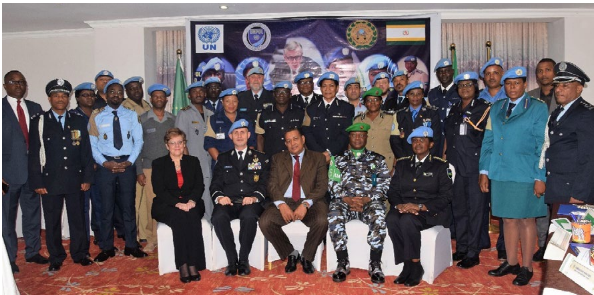
Réunion des chefs de police des missions de l'ONU à Addis-Abeba lors de la 3ème retraite des chefs des composantes police. 31 juillet - 2 août 2018.

Depuis la constitution des quatre piliers en 2000, des initiatives telles que Safe Cities et Safe Public Spaces for Women and Girls ont vu le jour en utilisant les outils numériques comme l'une des méthodes de mise en œuvre dans les communautés locales. À Maputo, au Mozambique, des écolières et écoliers ont organisé des ateliers pour discuter de questions cruciales visant à rendre la ville sûre pour les femmes et les filles. À la suite de cette activité, les médias sociaux ont été utilisés pour promouvoir