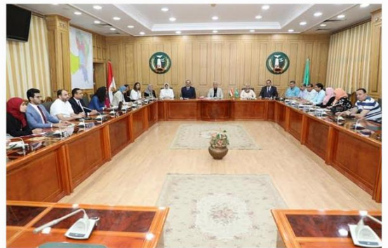
محافظ المنوفية يعقد اجتماعا مع منظمة العمل الدولية

محافظ المنوفية يعقد اجتماعا مع «العمل الدولية» لمتابعة «تشغيل الشباب»