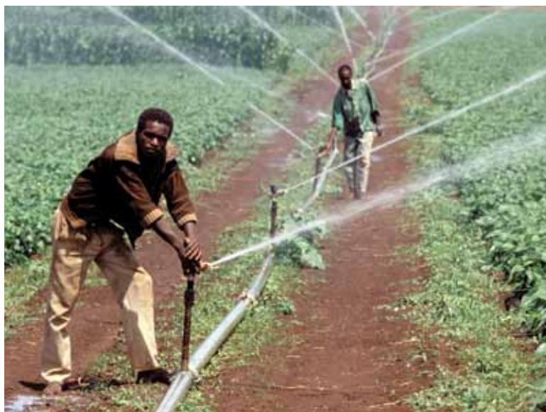
L'agriculture irriguée à Kilimanjaro, Tanzanie. Le développement de stations de pompage et d'autres infrastructures rurales est primordial pour augmenter la production et la gestion durable des terres.

Les récifs coralliens, par exemple, sont un habitat pour les poissons et la vie marine et une attraction touristique. Ils servent également de remparts contre les catastrophes naturelles dans les PMA insulaires, en absorbant l'impact des tempêtes de l'océan. Les forêts remplissent des fonctions similaires à l'intérieur des terres en protégeant la faune, promouvant les moyens de subsistance et atténuant les effets des émissions de gaz à effet de serre. Les pays les moins avancés dans le bassin du Congo de l'Afrique centrale sont des zones requérant un soutien international pour soutenir les ressources forestières de la planète.