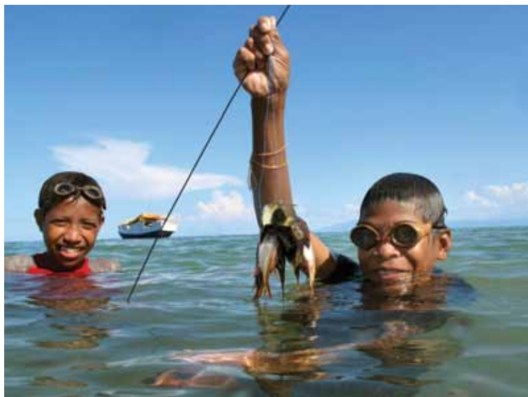
La diversité biologique est un atout énorme, Timor-Leste.

S'exprimant lors de la réunion de décembre 2009 sur le changement climatique à Copenhague et représentant le groupe des pays les moins avancés, le Premier ministre du Lesotho Pakalitha Mosisili a déclaré que « l'adaptation est pour les PMA une question de vie ou de mort. »