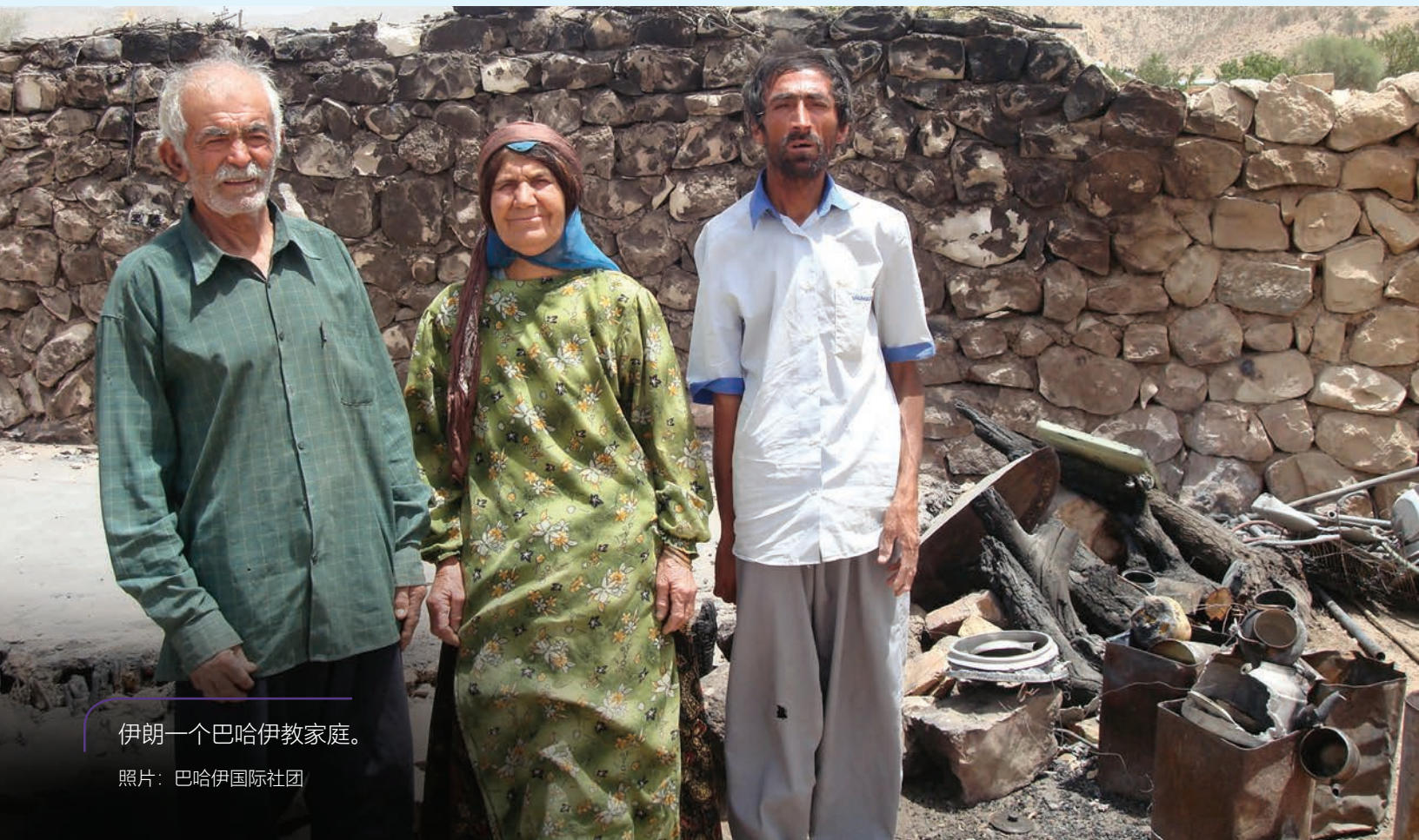
伊朗一个巴哈伊教家庭。