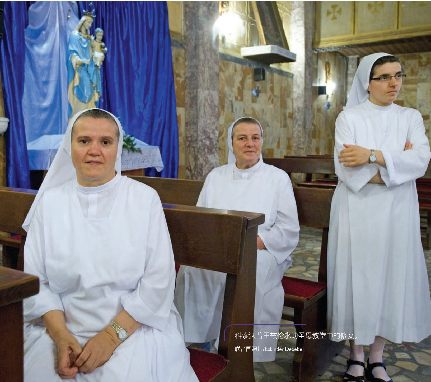
科索沃普里兹伦永助圣母教堂中的修女。