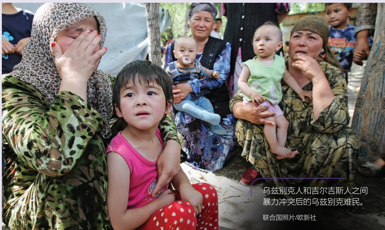
乌兹别克人和吉尔吉斯人之间暴力冲突后的乌兹别克难民。