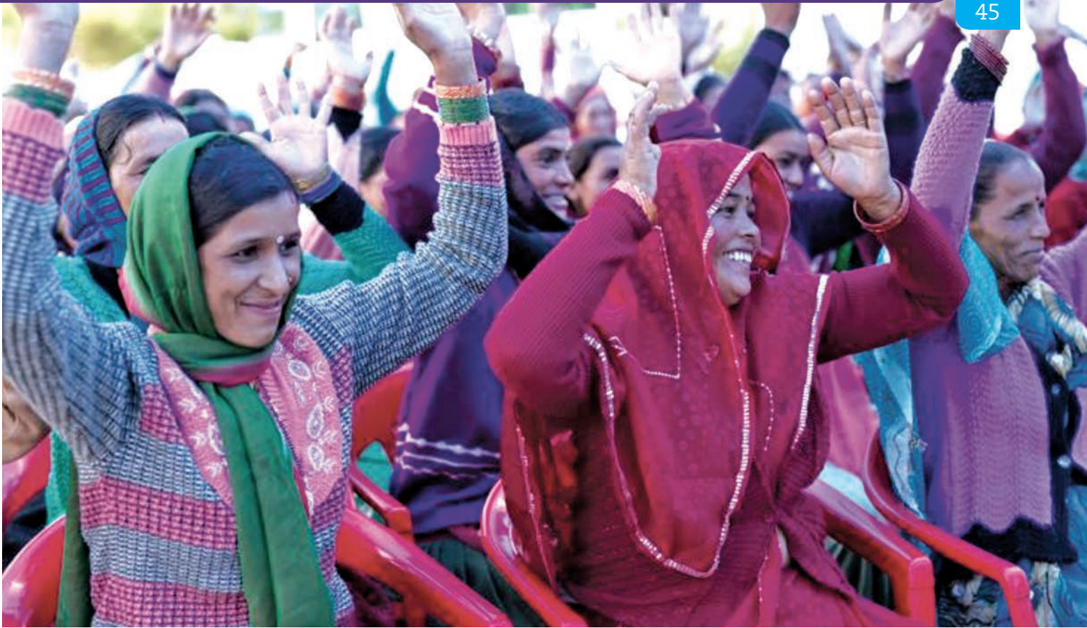
印度 Triyuginarayan 中心的印度教妇女。