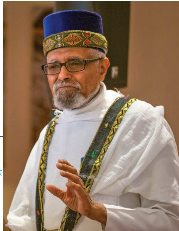
埃塞俄比亚犹太社区代表 Ephraim Isaac。