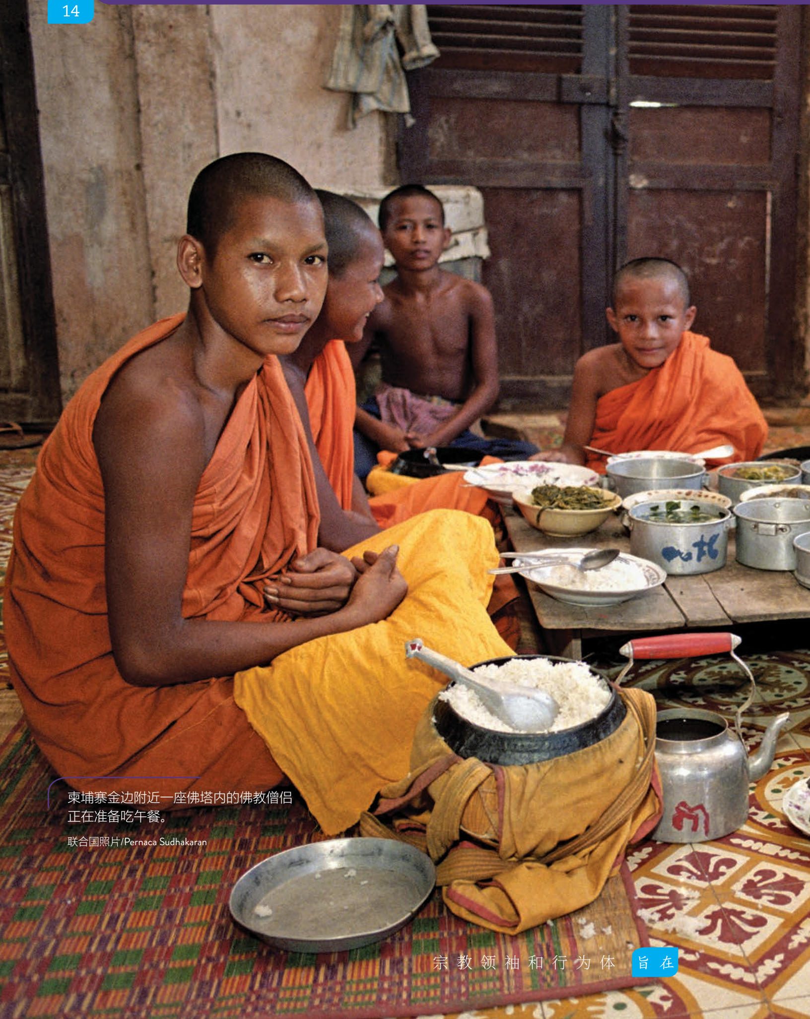
柬埔寨金边附近一座佛塔内的佛教僧侣正在准备吃午餐。