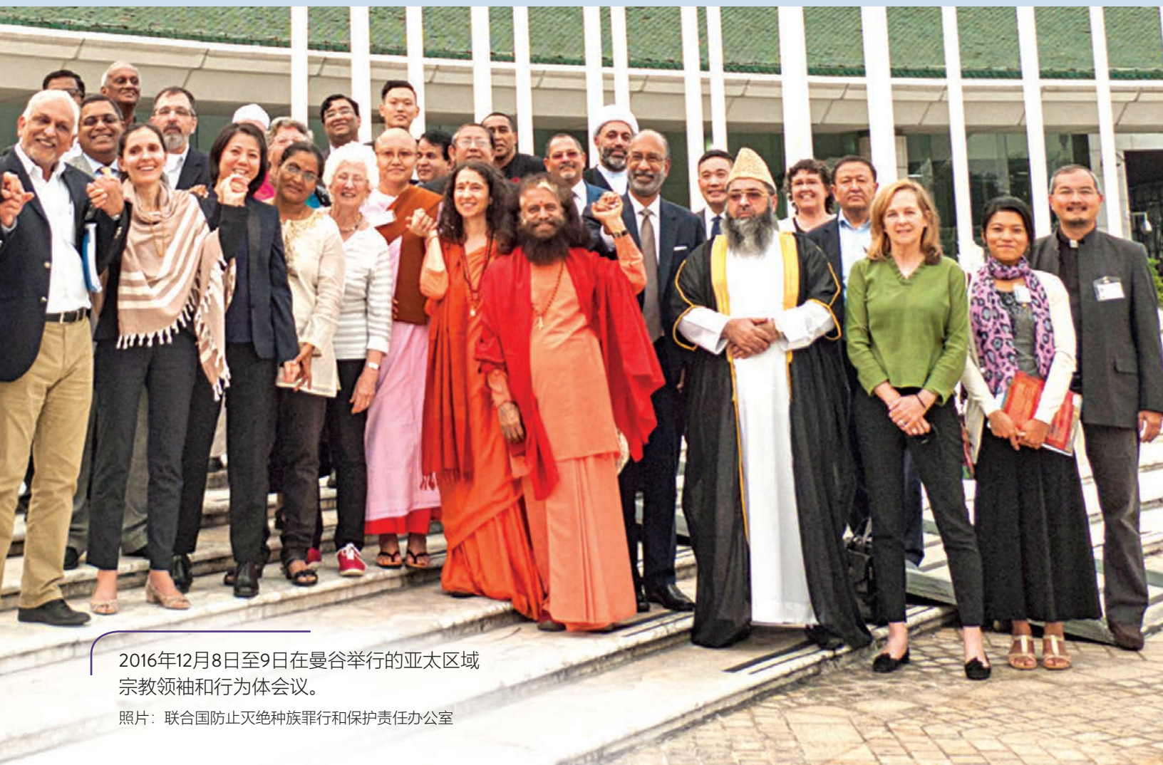
2016年12月8日至9日在曼谷举行的亚太区域宗教领袖和行为体会议。

应相互通报为防止、打击和应对煽动行为而采取的所有措施；发起联合声明/回应；以及协调行动，包括通过社交媒体协调行动。