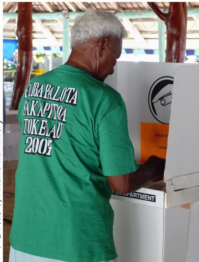
托克劳法考福，2007年10月： 在第二次关于托克劳通过与新西兰自由联合实现自治的公投中，一名当地居民投下了一张选票。

自治领土托克劳举行了两次全民投票，以决定其未来的地位。托克劳要通过与新西兰自由联合获得自治地位需经三分之二多数通过，但这两次公投的支持率都低于三分之二多数的门槛。因此，截至2020年，托克劳仍在非自治领土名单上。自那时起，托克劳一直在与新西兰合作，以着力解决各种发展需求。