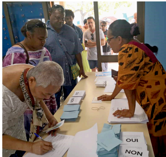
新喀里多尼亚努美阿，2018年11月： 新喀里多尼亚努美阿的投票站正在举行第一次自决公投。

行了关于获得完全主权和独立的全民投票。在该公投中，投票率为81%，完全主权和独立遭到否决（近57%的人反对，约43%的人赞成）。该《协议》规定，可在2020和2022年就这一问题再举行两次公投。如果三次公投全都否决独立，有关各方就必须开会审议由此造成的局面。二十四国委员会分别于2014和2018年（筹备2018年公投的关键时期）向新喀里多尼亚派遣了两个视察团。