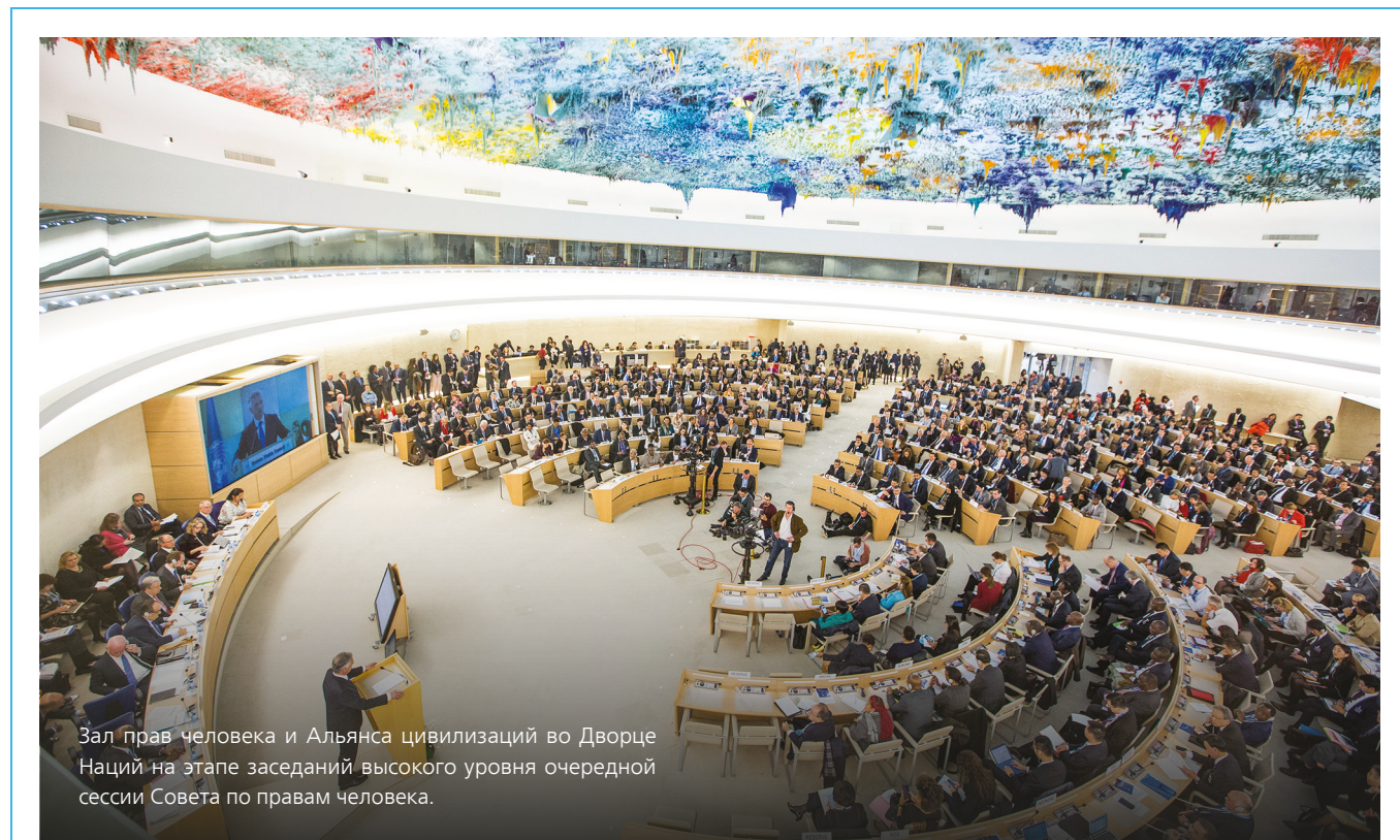
Зал прав человека и Альянса цивилизаций во Дворце Наций на этапе заседаний высокого уровня очередной сессии Совета по правам человека.

Содействие реализации повестки дня в области прав человека имеет ключевое значение для предотвращения нарушений прав человека. Организация Объединенных Наций продолжала вносить вклад в осуществление альтернативных мер по разрешению споров для обеспечения защиты прав уязвимых групп людей, например в контексте разрешения земельных споров и устранения напряженности в отношениях между внутренне перемещенными лицами, беженцами и принимающими общинами в Западной Африке. Организация разработала учитывающие права человека средства раннего предупреждения, которые помогают защищать гражданских лиц и предотвращать новые вспышки напряженности, обеспечивая соответствующим сторонам возможность лучше подготовиться и заблаговременно принять должные меры.