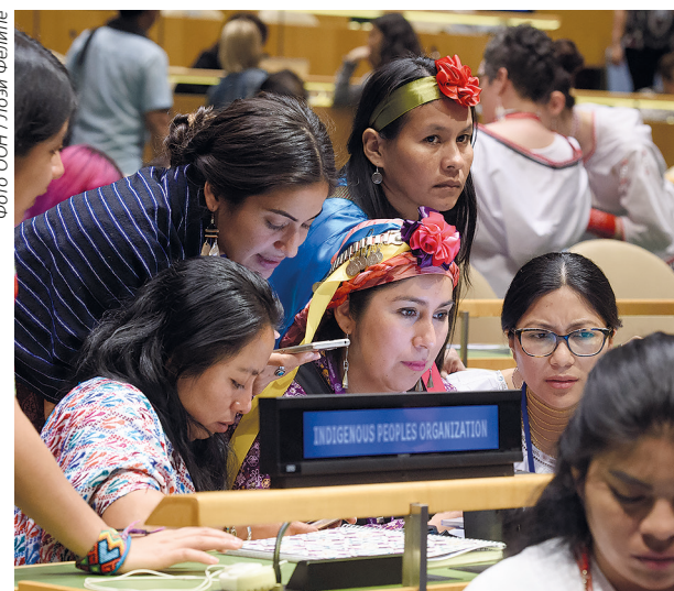
Участники первого заседания восемнадцатой основной сессии Постоянного форума по вопросам коренных народов, посвященной теме «Традиционные знания: обретение, передача и защита».

Как и в предыдущие годы, благодаря специальным процедурам Совета по правам человека, поддерживаемым