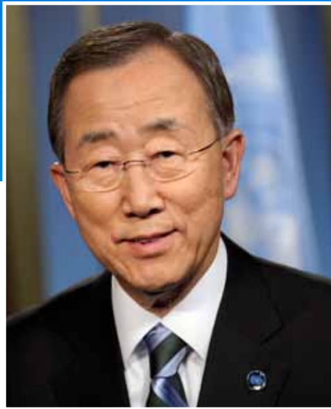
潘基文 联合国秘书长

世界海洋是维系地球生命的关键。海洋为90%的世界贸易提供连通渠道，将人类、市场和生计联系在一起。考虑到海洋的连通作用，全球各国应努力使海洋成为安全、持续开展海洋活动的场所，为全人类服务。