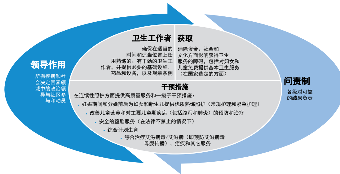
图1.孕产妇、新生儿和儿童健康全球共识

由广泛的利益攸关方制定和通过的《孕产妇、新生儿和儿童健康全球共识》（见图1），提出了加快进展的方针。它强调有必要根据一整套重点干预措施（卫生专业人员称为连续性照护）来调整政策、投资和服务提供，为利益攸关方提供了一个框架，以采取协调一致的行动。