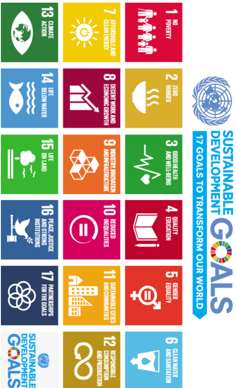
可持续发展目标活动工作表