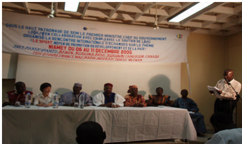
Ouverture officielle de la rencontre par le Ministre de la Jeunesse et Sports en présence de son Collègue de l'emploi et des responsables de l'OIF.