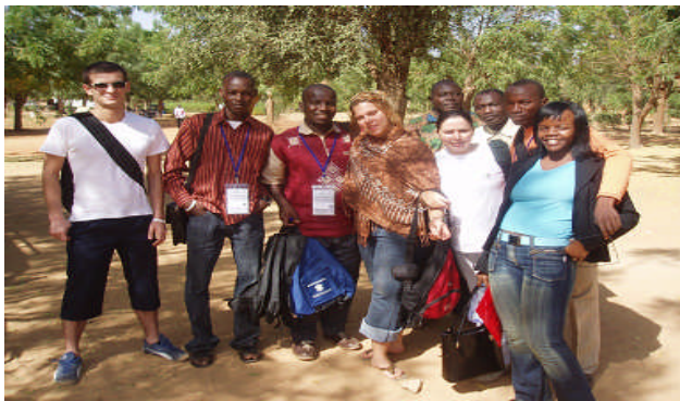
une vue de quelques participants en visite touristique