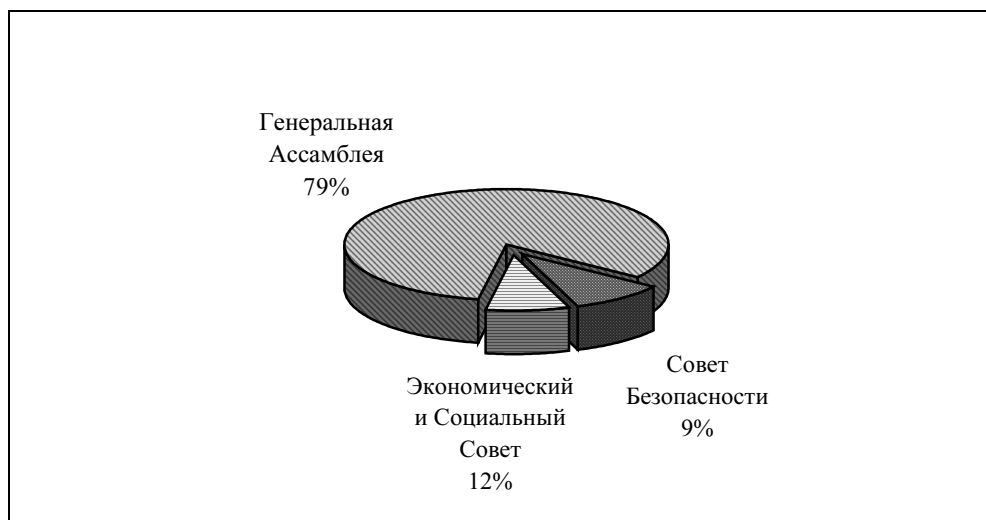
Диаграмма 1 Распределение действующих мандатов по главным органам*

* Это распределение отражает данные, содержащиеся в перечне мандатов, работа над которым продолжается.