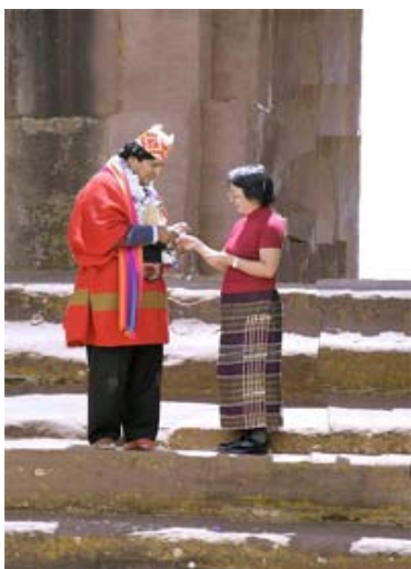
Evo Morales, Presidente de Bolivia y Victoria Tauli-Corpuz, Presidenta del Foro Permanente, enero 2006

Lanzamiento de la Película “Los Pueblos Indígenas