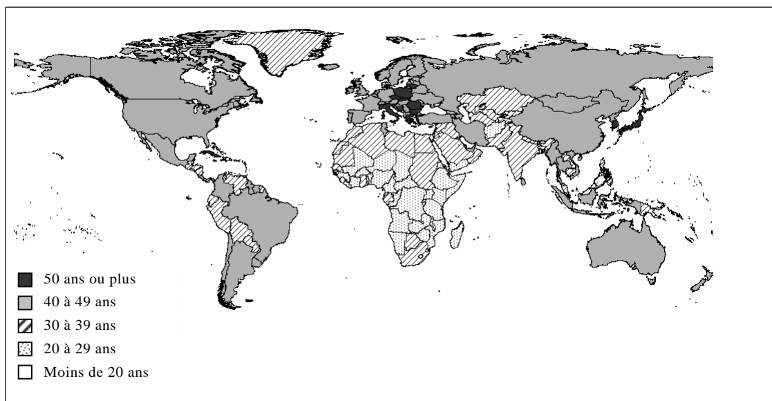
Carte 2 L'âge médian en 2050, variante moyenne