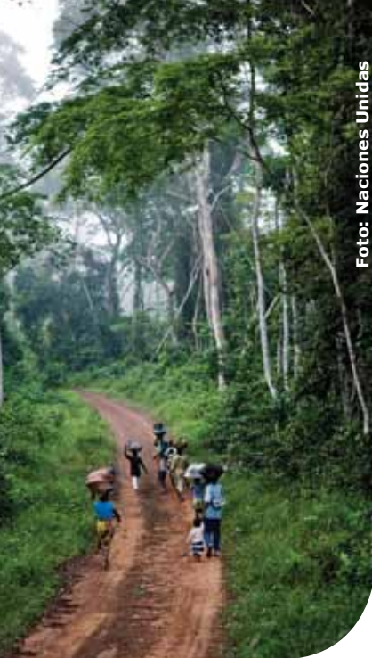
Bosques en Liberia