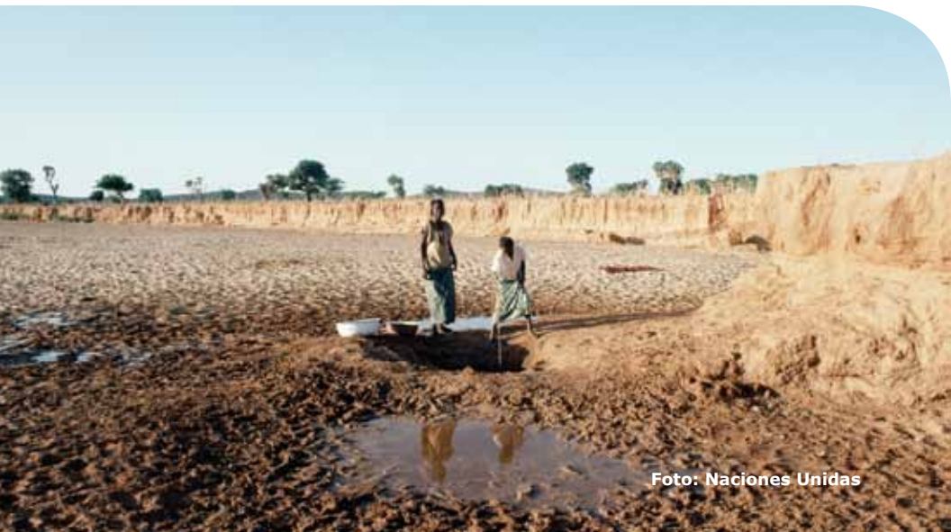
Cauce seco de un río en Níger

“El programa del desarrollo sostenible es el programa del crecimiento para el siglo XXI”.