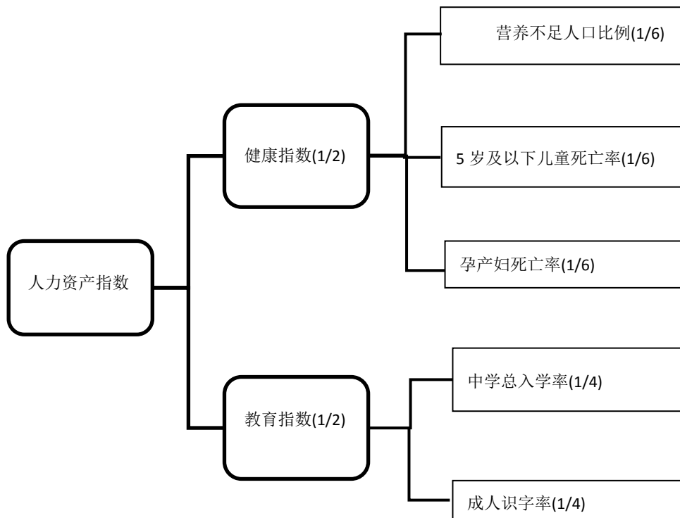
图三 人力资产指数的新组成

84. 基于上述考虑，人力资产指数将由5个指标组成：3个与健康有关(营养不足人口比例、5岁以下儿童死亡率和孕产妇死亡率)，均在健康分项指数中具有同等权重；两个与教育有关(成人识字率和中学总入学率)，两者在教育分项指数中具有同等权重。如图三所示，教育和健康分项指数在人力资产指数中具有同等权重。