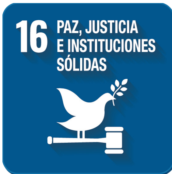
Logo de los Objetivos de Desarrollo Sostenible (ODS) 16 de la Organización de las Naciones Unidas

Un servicio policial inclusivo de calidad para las personas con discapacidad requerirá desarrollar, implementar y evaluar la aplicación de un conjunto de normas